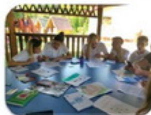
"Pescuitul" "Vânătoarea de comori" "Aritmogriful"